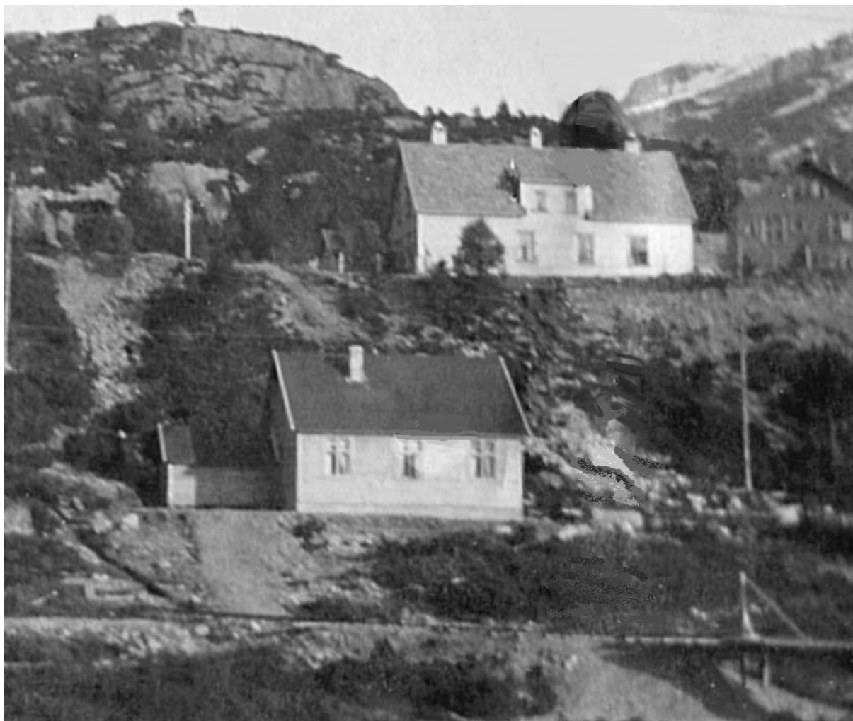
Sjukestova nedanfor Hus 3.

Konsesjonsvilkåra tilsa at Kraftselskapet måtte syte for sjukestove på staden. Næraste sjukestove var i Bergen og det tok eit døgn og komme dit med båt. Båten gjekk 2-3 gongar i veka.