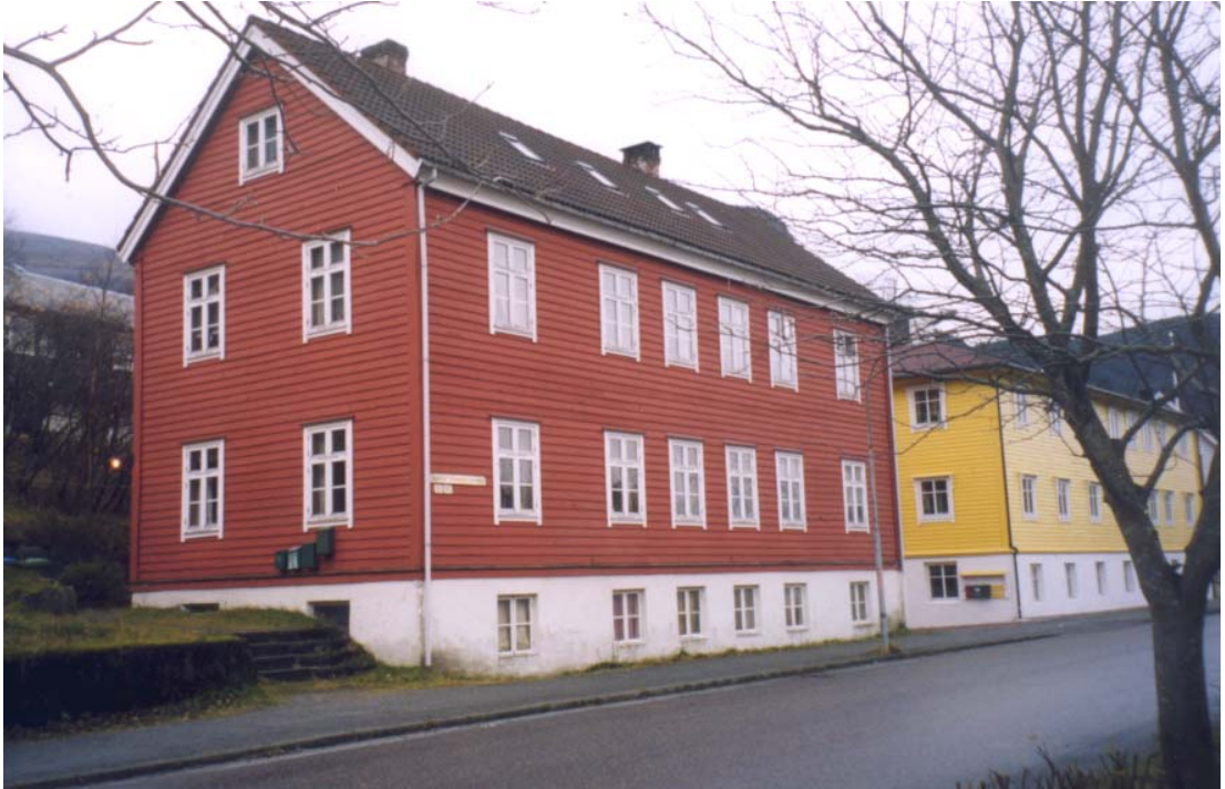
Biletet viser verna bygningar i område BB7: familiebustad for arbeidarar og ungdomsmess

Kapellet og samfunnshuset er døme på at spesielle bygningar i tettstadane har skilt seg ut frå dei andre, både ved funksjon, plassering, storleik og arkitektur. I tillegg kjem hus som er spesielle fordi dei fortel ei historie om tidlegare bruk av området: Nausta på Naustneset, Risetunet, direktørbustaden, Bakketunet for funksjonærar og det raude huset i Gunnar Schjelderupsveg for arbeidarar. Sjå føresegnene for oversikt over bygningar som er gjeve eit vern i reguleringsplanen.