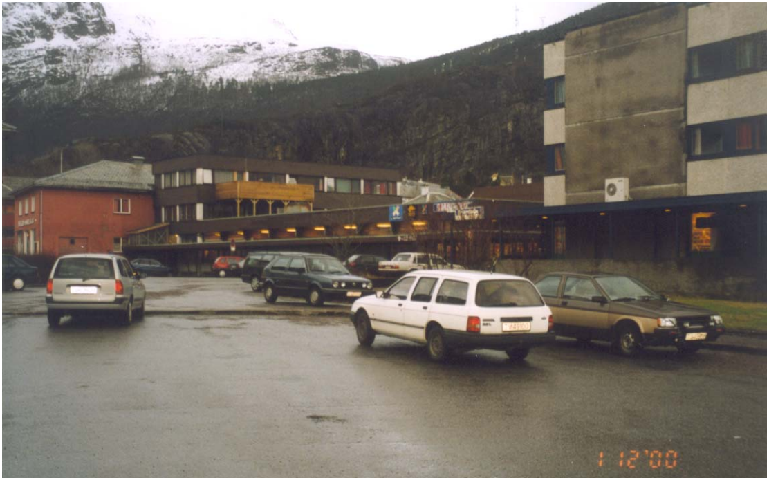
Parkeringsareala må oppstrammast

Parkeringsareala er i dag generelt store, utflytande asfaltareal utan særleg strukturering mellom køyreareal, parkeringsareal og gangareal. Planen legg opp til ei vesentleg oppstramming av dette, utan at kapasiteten vert endra særleg i høve til idag.