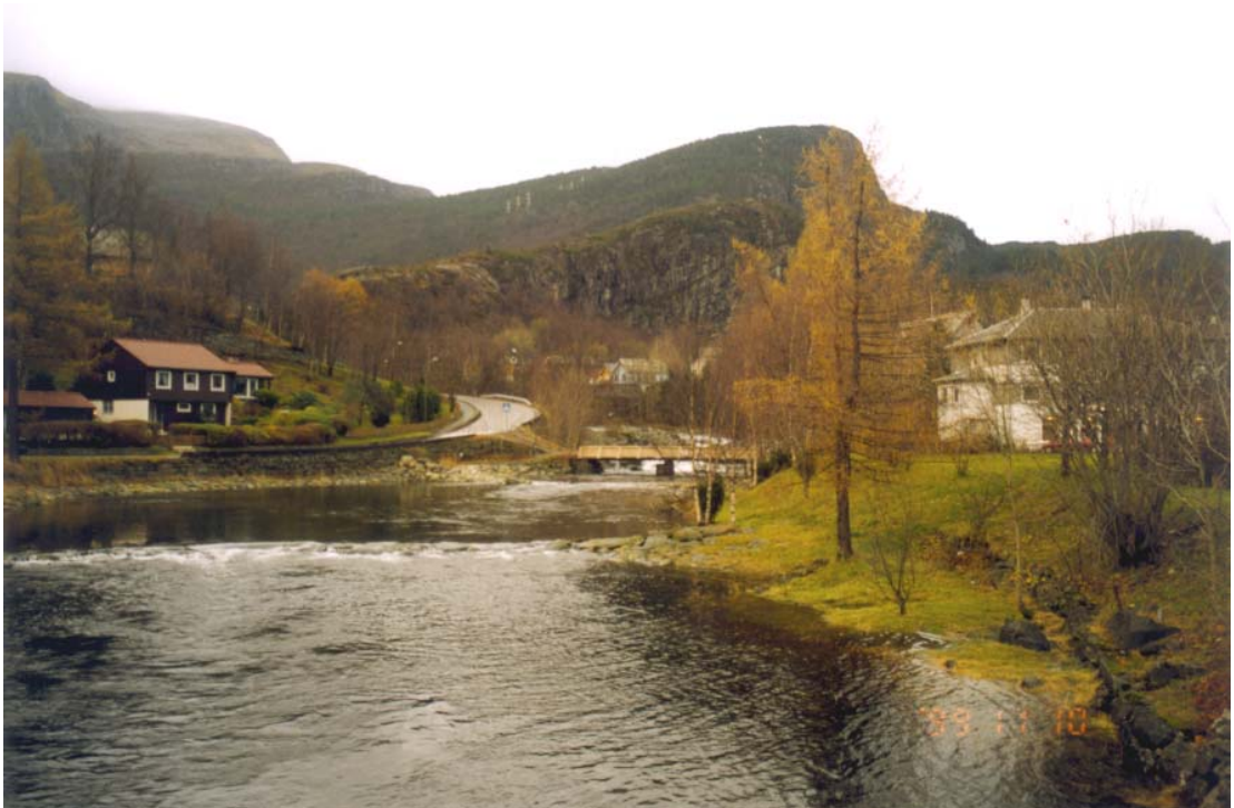
Miljøet langs Riseelva er eit verdifullt friområde

Område som kan og bør opparbeidast med parkmessig kvalitet, beplantning, sitjeplassar, gangstiar m.v.