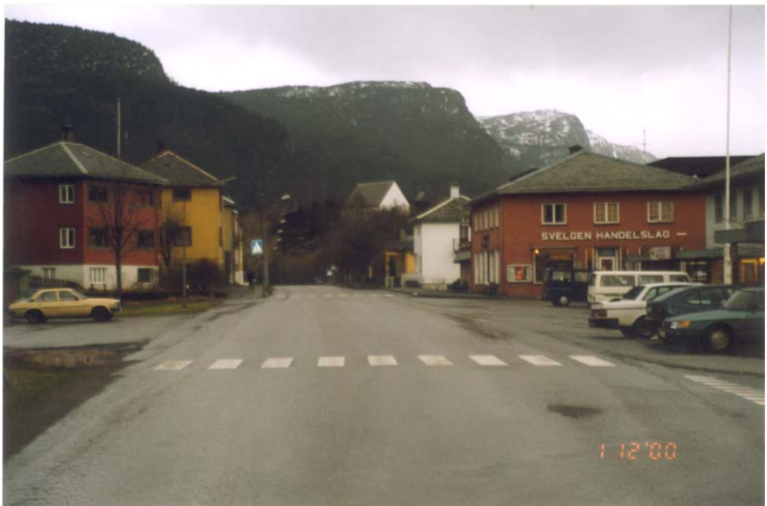
Gunnar Schjelderupsveg treng ei klar avgrensing mellom køyreareal, parkeringsareal og gangareal

Riksveg 614, ( G.. Schjelderupveg), er både gjennomfartsveg, fordelingsveg og “port” til Svelgen. Denne gata betyr difor mykje for opplevinga av Svelgen både for lokaltrafikk og gjennomkøyrande. Ein velstrukturert veg med fortau, parkering, beplantning og bruk av kvalitetsmaterialar vil gje god effekt på inntrykket av sentrum. Parkeringsareala må opparbeidast med markerte parkeringsfelt, gjerne med beplantning.