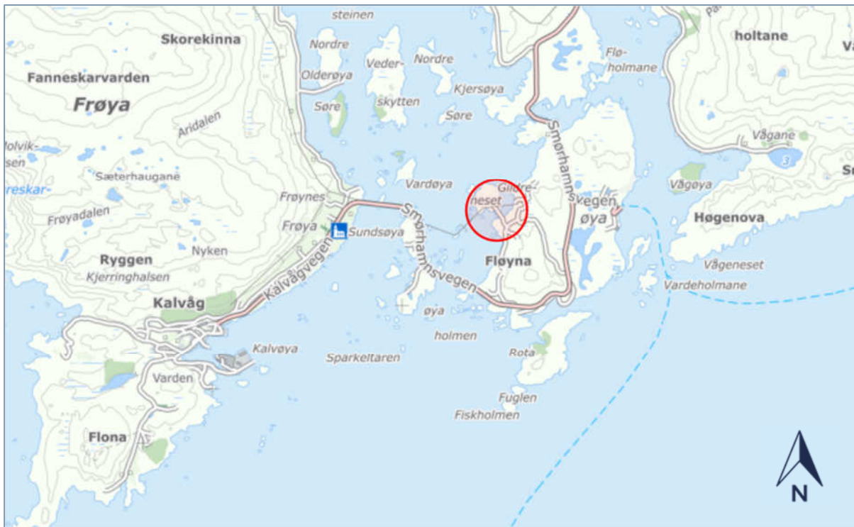
Figur 1 Oversiktskart som viser lokalisering av området. Området er markert med raud ring (Kommunekart.no)