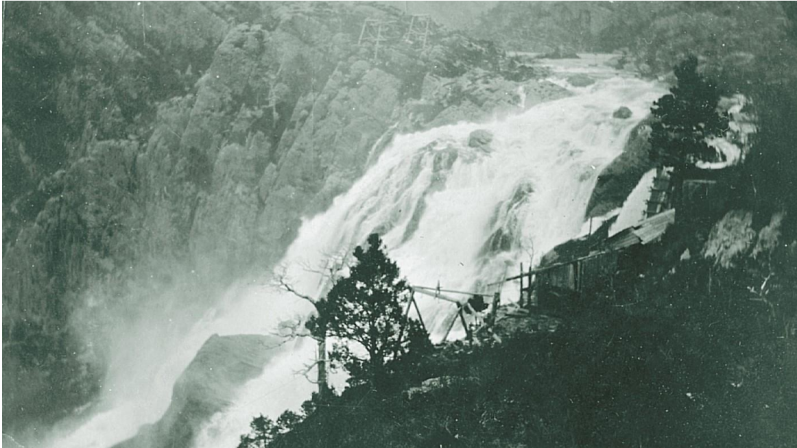
Svelgselva hadde sterke krefter

Vasskrafta har i generasjonar vore nytta som drivkraft for sager, møller og ullvalker.