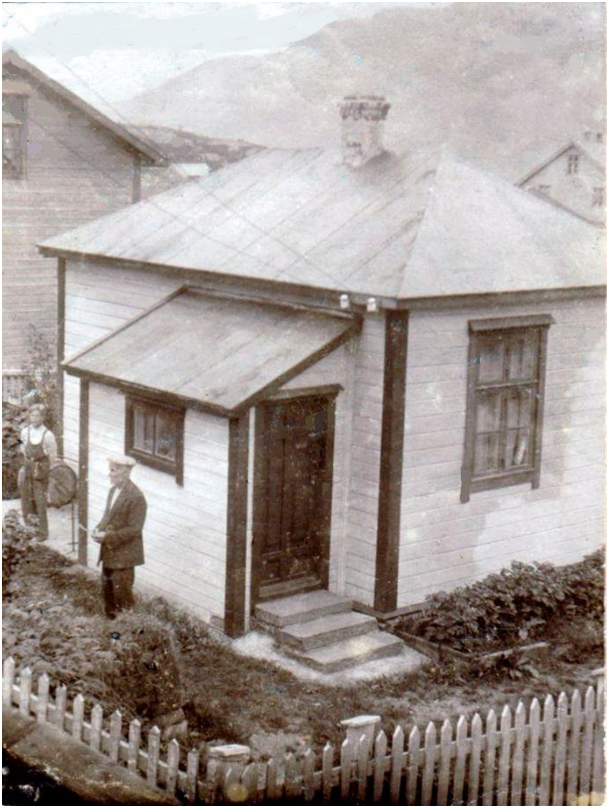
Huset til Knalltuten slik det stod i sentrum av Svelgen.