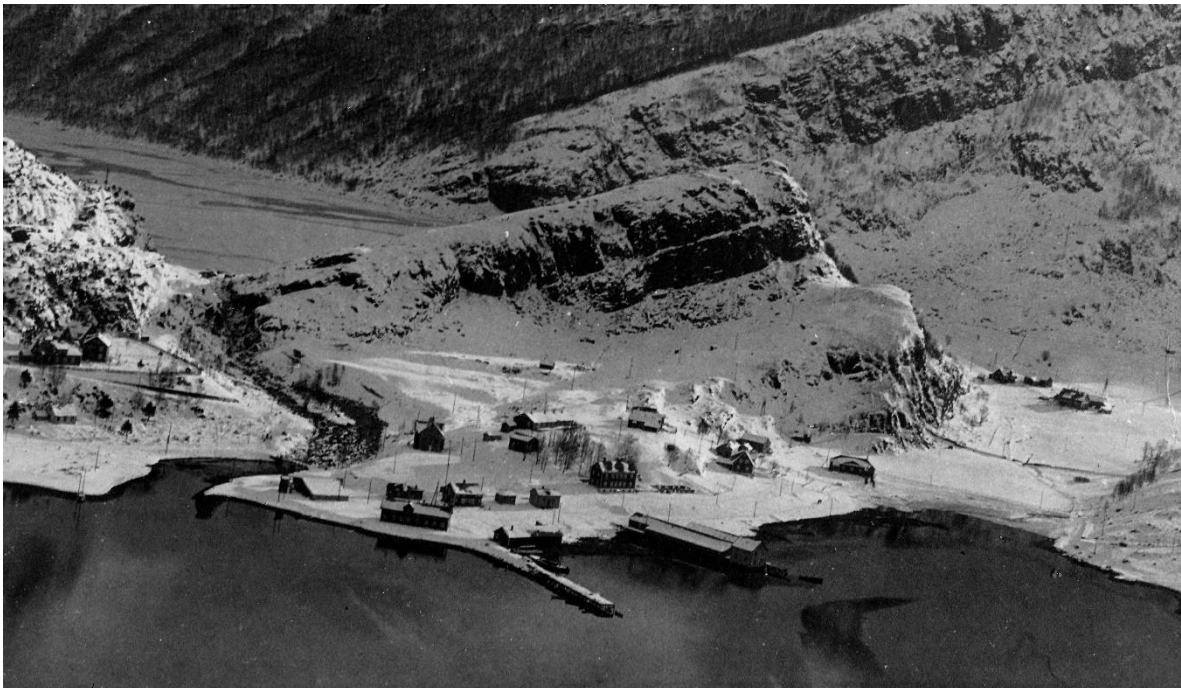
Svelgen sentrum. Ein antar at dette er etter brannen i 1918.

I november 1918 oppsto det ein storbrann på Brakkehaugen. To av 20-mannsbrakkene brann ned. Alt i januar 1919 kunne folk flytte inn i nye brakker ved Svelgselva. Her kom opp ei 40-mannsbrakke og ei 20-mannsbrakke. Mundalsbrakka låg der frå før.