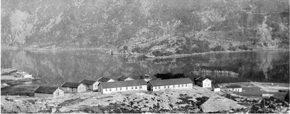
Brakkene på Brakkehaugen ca. 1918.

I 1918 blei det bygd 5 brakker med plass til 20 mann i kvar, og 2 brakker med plass til 40 mann.