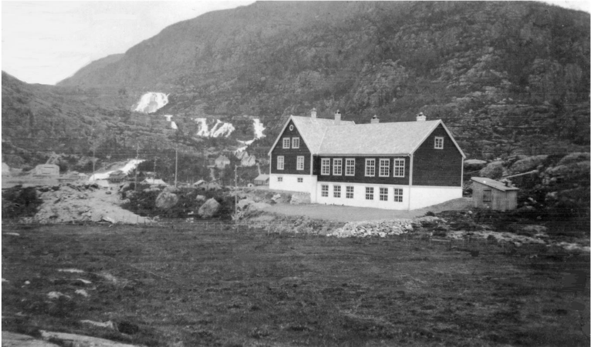
Svelgen skule /«Realen». Bygd i 1922

Nordgulen skulekrins hadde ikkje eige skulehus. Undervisninga flytta frå gard til gard, men var mest på Eikeland. Det var ein strabasiøs tur for skuleungane frå Sande og Rise og komme seg til Eikeland, spesielt vinterstid når det var is på fjorden. Dei budde i periodar på Eikeland, og låg i flatsengar på loftet.