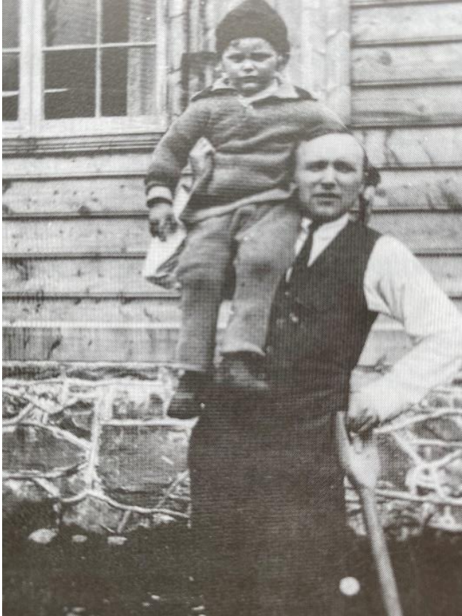
Hus 13, Rustadtun , 1919 (seinare «Messa»)

Blei bygd som kontor og bustad for arkitekt Rustad som stod for den første reguleringsplanen i Svelgen fra 1917, og seinare teikna dei fleste av Verket sine bustader.