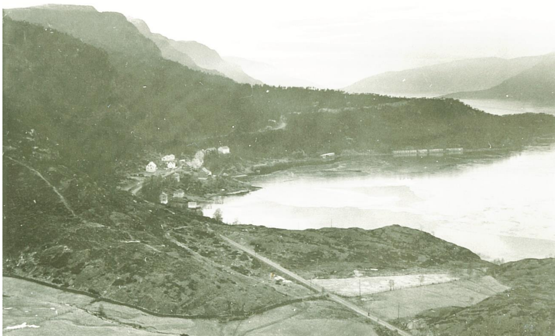
Mot Langeneset og Breivika