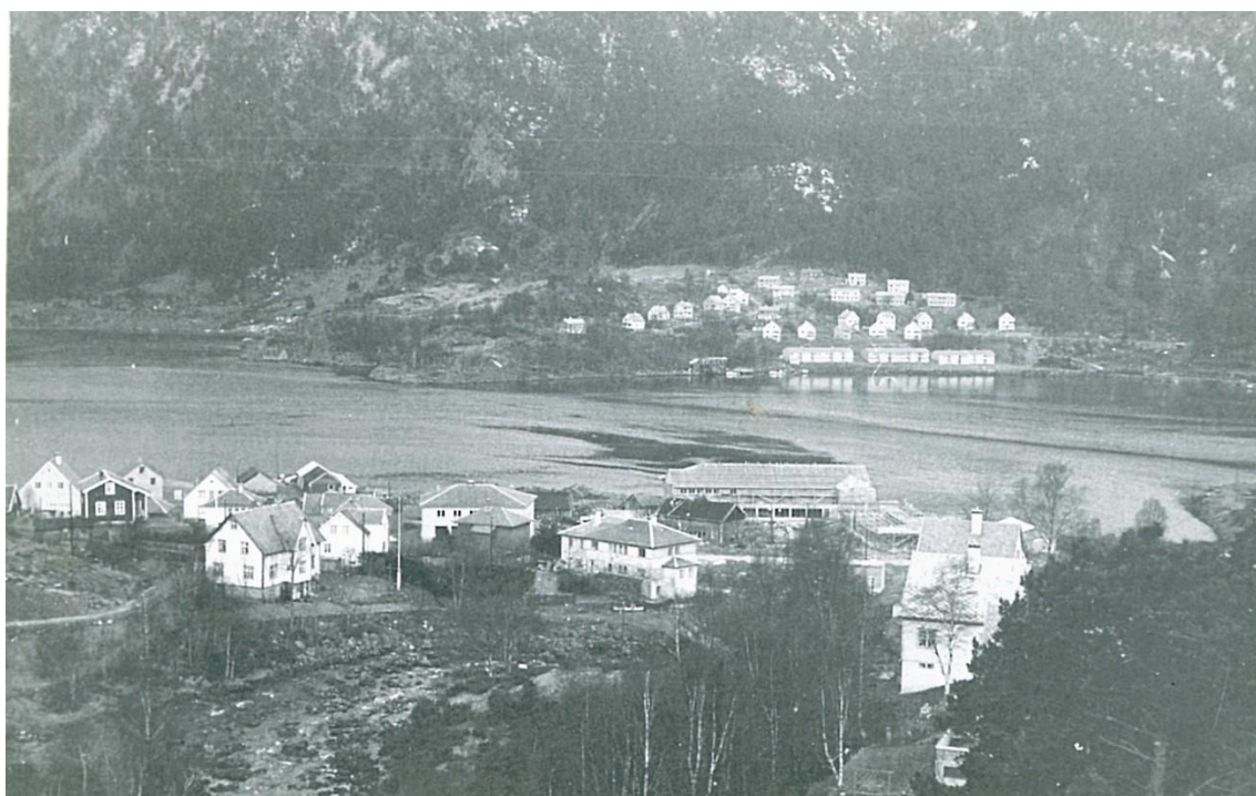
Sentrum og starten på bustadbygginga på Sande

Utan foto og kunnskap frå fleire som enno kan fortelje historia om utviklinga av Svelgensamfunnet, kunne vi ikkje laga denne kulturminneløypa.