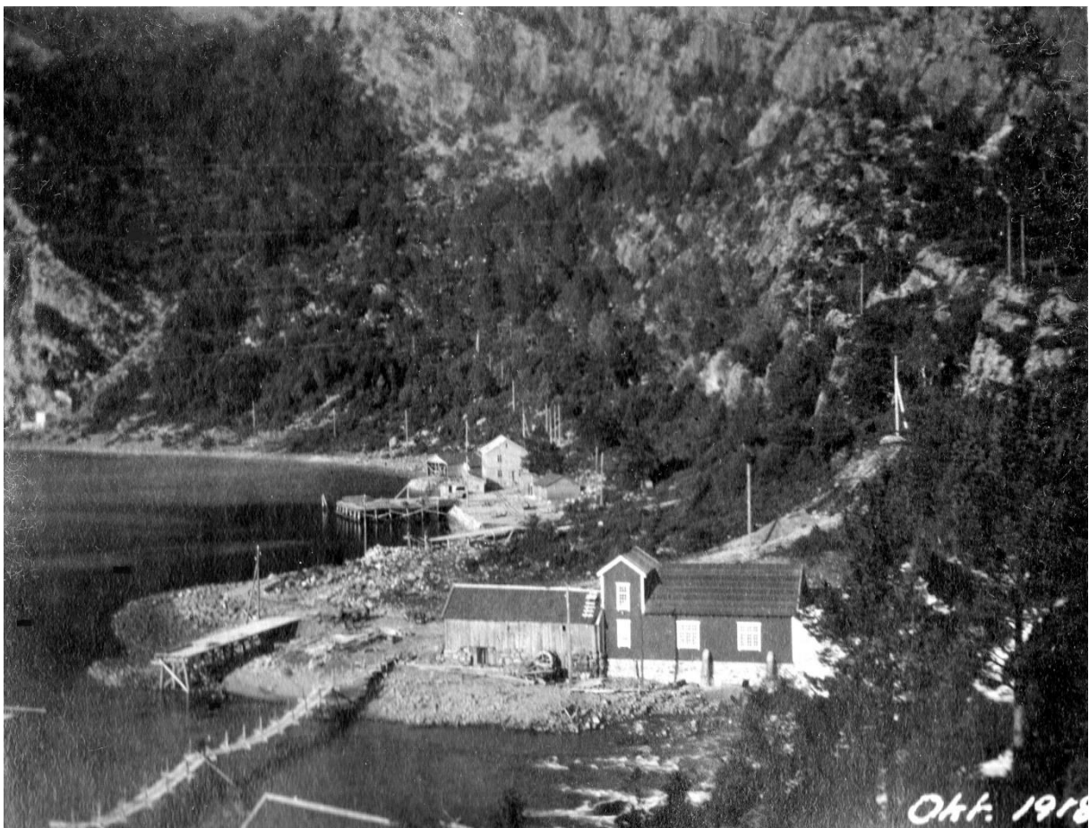
«Provisoren» bak Sandesaga

i eiga utstilling. I denne historia konsentrerer vi oss om Svelgensamfunnet.