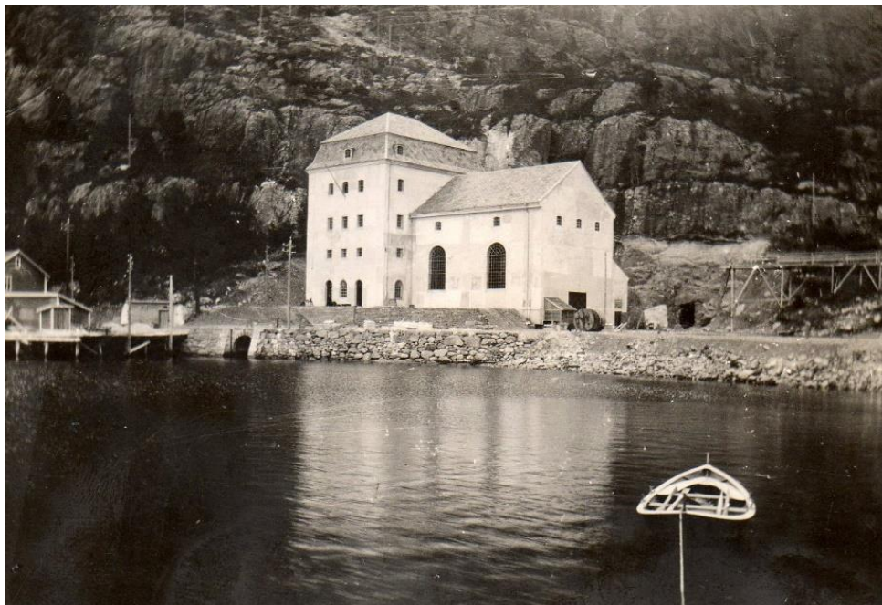
Kraft 1 står ferdig i 1921

Vi skal no ta deg gjennom Svelgen si utvikling fram til den industristaden vi kjenner i dag.