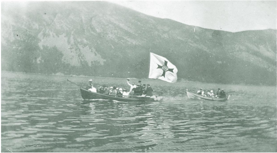
Fråhaldsrøysla på veg ut Nordgulen

Rundt 1914 vart A/S Bremanger kraftselskap skipa, og i 1921 stod den nye kraftstasjonen ferdig. Dette var første steget på vegen som skulle forandre bygda til ein moderne industristad. Staden fekk namnet Svelgen etter den vassrike elva som var grunnlaget for utviklinga.