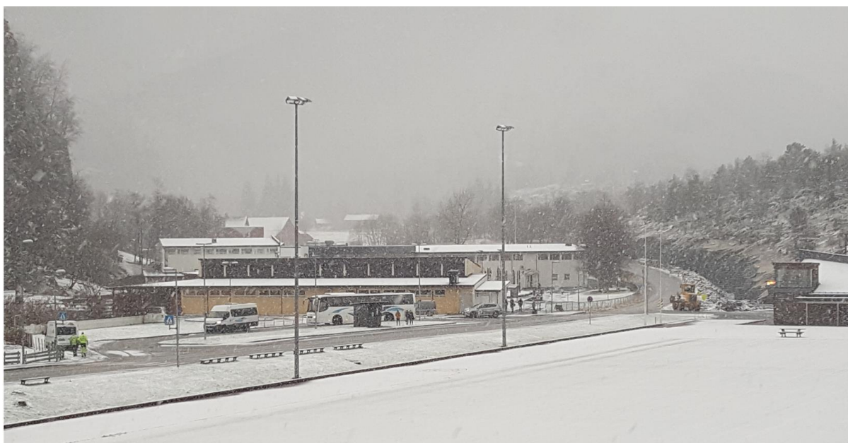
Svelgen skule 25.11.2021, ved skuleslutt cirka kl 1435

Vedteken i Bremanger kommunestyre, sak 072/21 den 16.12.2021.